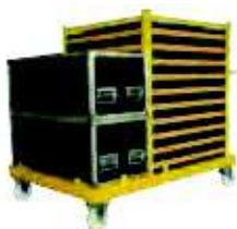
► Le chariot

Les planchers peuvent également s'empiler les uns sur les autres.